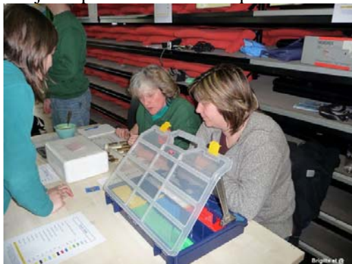
A quelle équipe !