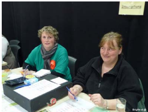
Et sérieuses avec ça !