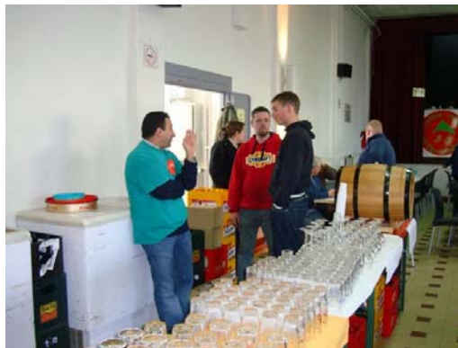
Les hommes !